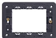
21613 - Soporte 3M con tornillos