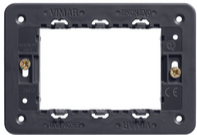
21613 - Soporte 3M con tornillos