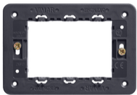
21613 - Soporte 3M con tornillos