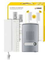
K40542.E - Kit portero 2F+ 1 fam. 40542+40141