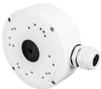
46922.041 - Soporte contactos cámara IP