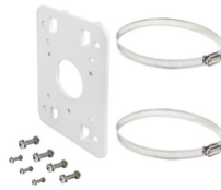
46917.005 - Soporte poste cámaras IP