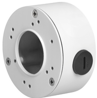
46922.030 - Soporte contactos Bullet VF