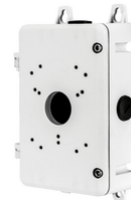
46922.033 - Caja contactos+alimentador