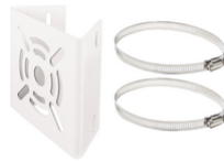
46917.004 - Soporte para poste cámara AHD FF+VF