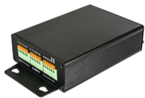
46936.001 - Alcance alarmas USB