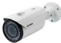
4651.2812ES - Cám.Bullet AHD 5Mpx 2,8-12mm