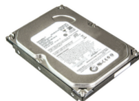
46925.030 - HDD profesional SATA 3,5in 3TB p/DVR