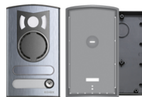
13K1 - Placa a/v 1 tecla aluminio