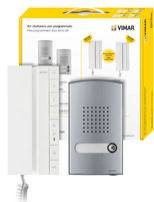
K40542.E - Kit portero 2F+ 1 fam. 40542+40141