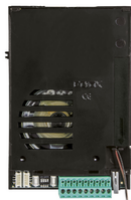
13F1 - Unidad Due Fili para placa audio