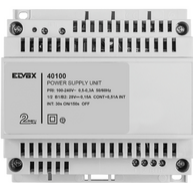
40100 - Alimentador interfono 2F+ 100-240V 0,6A