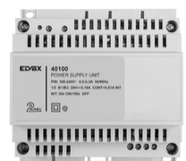
40100 - Alimentador interfono 2F+ 100-240V 0,6A