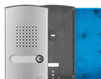
40141 - Placa entrada audio 1 familia