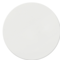
V71632 - Tapa plano 2M