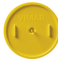
V71011 - Tapa antimortero ø60mm amarillo