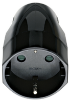
00250 - Prise 2P+T 16A allemand axial noir