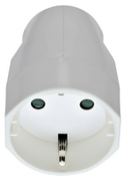
00250.B - Prise 2P+T 16A allemand axial blanc