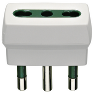
00300.B - Adaptateur S17+P17/11 blanc