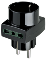
00325 - Adaptateur mult. S31+2P17/11+P30 noir