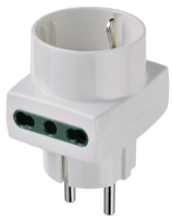
00325.B - Adaptateur mult. S31+2P17/11+P30 blanc