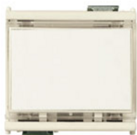
08420 - Poussoir porte-étiquette 1P NO10A 12-24V