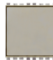
20050.N - Poussoir porte-étiq.1P NO 10A Next