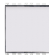
19050.B - Poussoir porte-étiq.1P NO 10A blanc