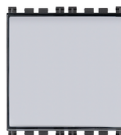
19050 - Poussoir porte-étiq.1P NO 10A gris