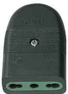
01029 - Prise 2P+T 16A P17/11 axial noir