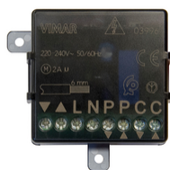
03996 - Quid - Module relais stores