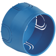
V71001 - Boîte d'encastr. ø60mm azur