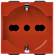
09210.R - Prise 2P+T 16A universel rouge