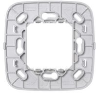
19507.RN.B - Support commande RF plaque Round blanc