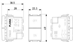
Dessin dimensions hors-tout