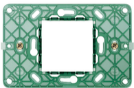
14612 - Support 2M centraux +vis