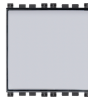
19050 - Poussoir porte- étiq.1P NO 10A gris