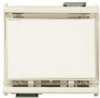
08420 - Poussoir porte- étiquette 1P NO10A 12-24V