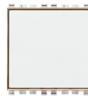
20050.B - Poussoir porte- étiq.1P NO 10A blanc