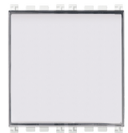
19050.B - Poussoir porte- étiq.1P NO 10A blanc