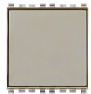
20050.N - Poussoir porte- étiq.1P NO 10A Next