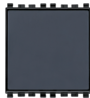
20050 - Poussoir porte- étiq.1P NO 10A gris