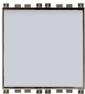
19050.M - Poussoir porte- étiq.1P NO 10A Metal