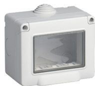
14903 - Enveloppe IP55 3M