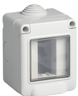
14901 - Enveloppe IP55 1M