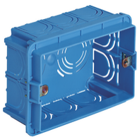
V71303 - Boîte d'encastr.rectang. 3M azur