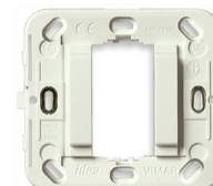
17086.B - Support lisse 1M s/vis ø60/56x56mm blanc