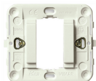
17080.B - Support lisse 1M +griffes blanc