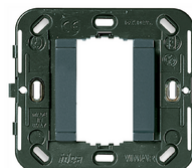
17086 - Support lisse 1M s/vis ø60/56x56mm gris