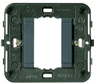
17080 - Support lisse 1M +griffes gris