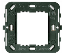
17087 - Support 2M réduits s/vis ø60/56x56mm gris