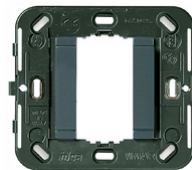
17086 - Support lisse 1M s/vis ø60/56x56mm gris