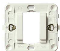
17080.B - Support lisse 1M +griffes blanc