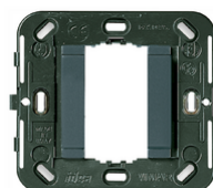
17086 - Support lisse 1M s/vis ø60/56x56mm gris