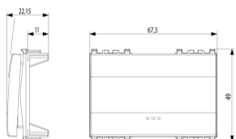
Dessin dimensions hors-tout