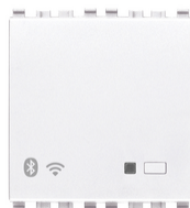
20597.B - Gateway connecté IoT 2M blanc