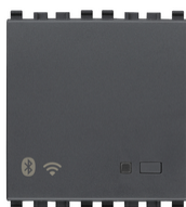
20597 - Gateway connecté IoT 2M gris