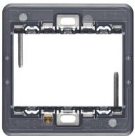
20608 - Support 3M BS