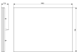
Dessin dimensions hors-tout