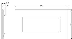
Dessin dimensions hors-tout