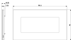
Dessin dimensions hors-tout