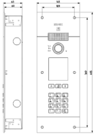
Dessin dimensions hors-tout