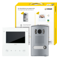
K40515.E - Kit portier-vidéo 1F Tab5SUp Wi-Fi+1300E