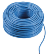
732H.E.100 - 2F+ câble 2x1 pose intér. PVC Eca 100m