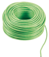
732I.E.100 - 2F+ câble LSZH 2x1 pose extér. Eca 100m