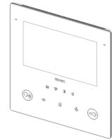
Dessin dimensions hors-tout