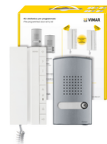
K40542.E - Kit interphone 2F+ 1 fam. 40542+40141