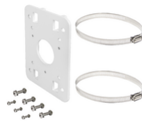
46917.005 - Étrier de mât caméras IP