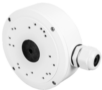
46922.041 - Etrier contacts caméra IP