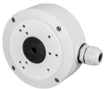
46922.040 - Etrier contacts caméra IP