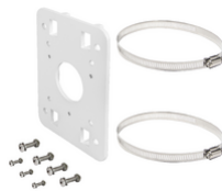
46917.005 - Étrier de mât caméras IP