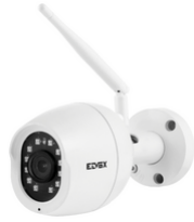
46237.040A - Cam. Bullet Wi-Fi Full-HD 1080p 4mm