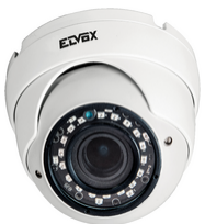
4652.2812ES - Cam.Dome AHD 5Mpx 2,8-12mm