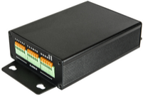
46936.001 - Extension alarme USB