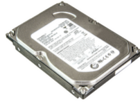
46925.030 - HDD professionnel SATA 3,5in 3TB p/DVR