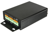
46936.001 - Extension alarme USB