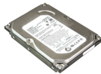
46925.030 - HDD professionnel SATA 3,5in 3TB p/DVR