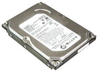
46925.030 - HDD professionnel SATA 3,5in 3TB p/DVR