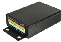
46936.001 - Extension alarme USB