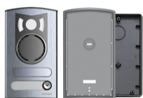
13K1 - Plaque a/v 1 touche alu